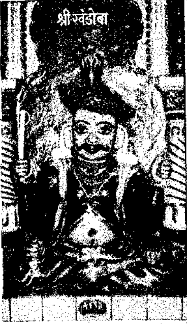
शिरडी येथील 'श्री खंडोबा'

खंडोबा आणि जोतिबा हे दोन देव शिवरूप बनण्याच्या प्रयत्नात असूनही आपली मूळ प्रकृति स्वतंत्र सांभाळून आहेत. वेगवेगळ्या माहात्म्य कथांनी यांना शिवावतार बनविण्याचा आटोकाट प्रयत्न करूनही मूर्तीविधानाच्या तथा उपासनेच्या बाबतीत त्यांचे स्वतंत्र अस्तित्त्व सतत जाणवते आहे. या जोतिबासच खळनाथ असेही म्हटले जाते. दक्षिण किनारपट्टी, कोंकण, गोमंतक येथे हा याच नावाने प्रसिद्ध आहे. खंडोबा, जोतिबा आणि खळनाथ यांचे प्रकृतिसाम्य एकच दिसते.