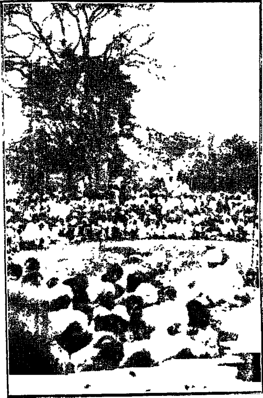
“ आहाड ” ( छायाचित्र )