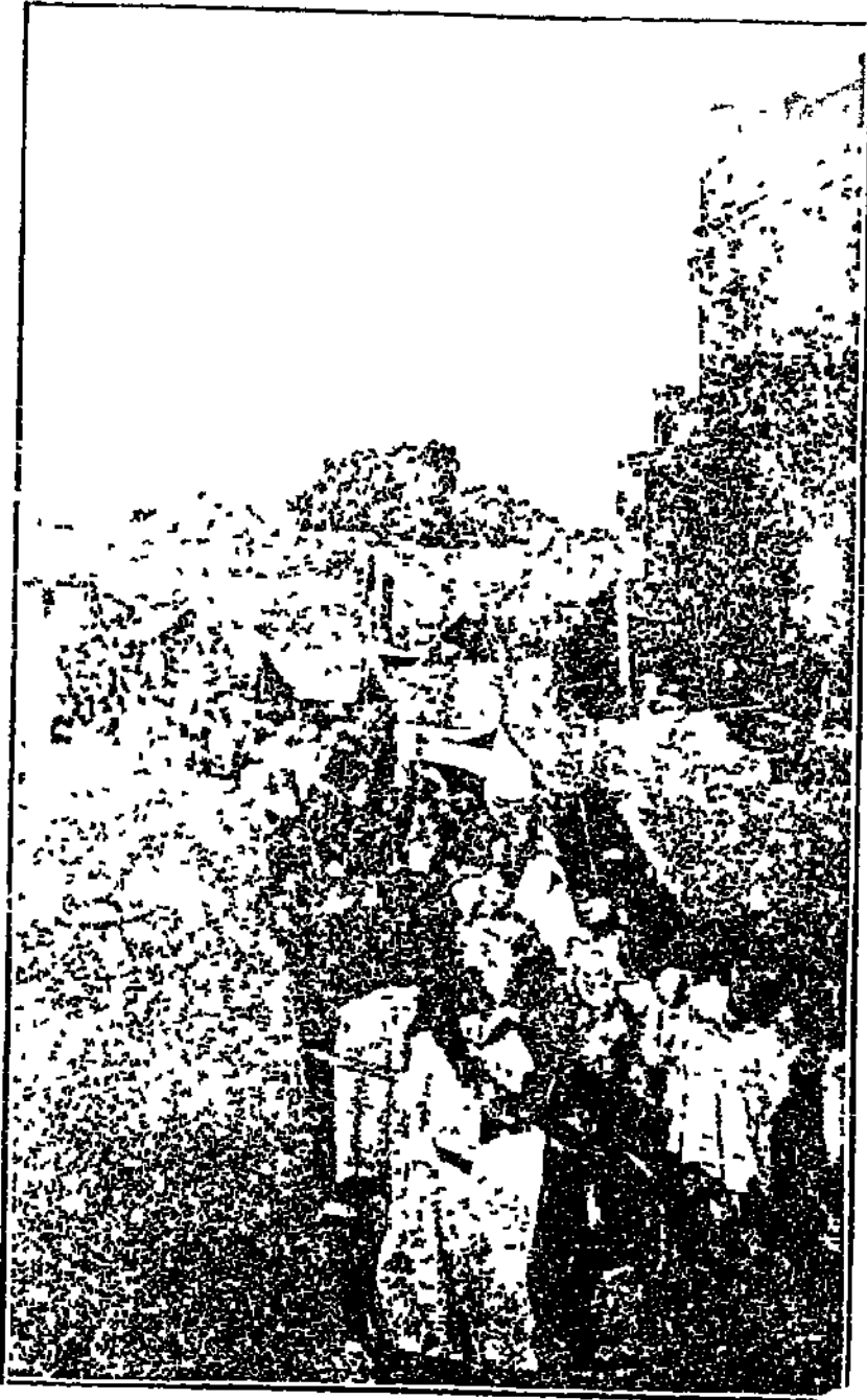
शिर्डी येथील रामनवमीचे यात्रेचा