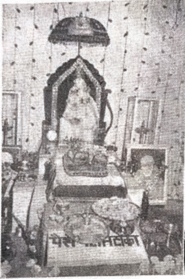
श्रीसाईच्या मूर्ती समोर श्रींच्या पादुका दिसत आहेत