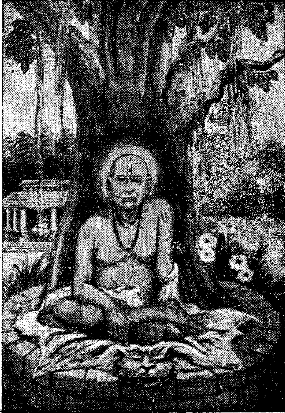
श्रीसद्गुरु स्वामी महाराज, अकलकोट

* श्रीभगवान दत्तात्रेयांचे द्वितीय अवतार श्रीनृसिंह सरस्वती यांचे अवतार किंवा साक्षात श्री नृसिंह सरस्वती म्हणजेच पूर्णब्रह्म भगवान श्रीस्वामीसमर्थ अकलकोट हे होत अशी श्री दत्तभक्तांची गाढ श्रद्धा आहे. इ. स. १८५७ च्या सुमारास अकलकोटच्या आध्यात्मिक क्षितीजावर अखिल विश्वाचा आभास मावळून टाकण्यासाठी श्रीस्वामी दत्तस्वरूपात प्रगट झाले. अकलकोट येथे त्यांनी २३ वर्षे