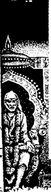
मुंबईच्या डॉक्टरांना श्रीरामाच्या स्वरूपात बाबांचे दर्शन