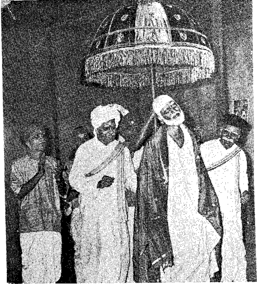
आरती थिएटर्स ( मुंबई ) निर्मित " शिरडीचे श्रीसाईबाबा " वा नाटकातील श्रीसाईंब्या मिरवणूकीचे दृश्य.