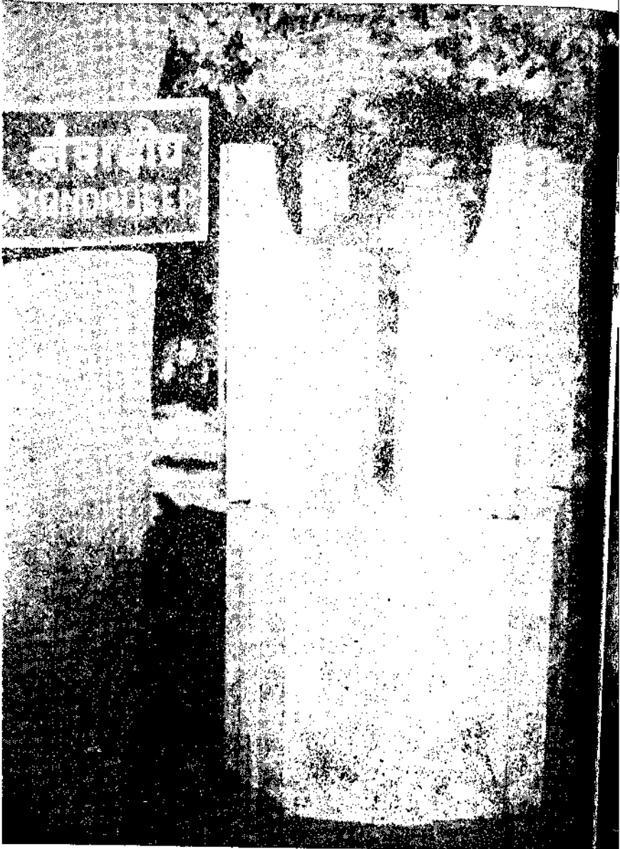
लेंडी बागेतील नंदाक्षीप