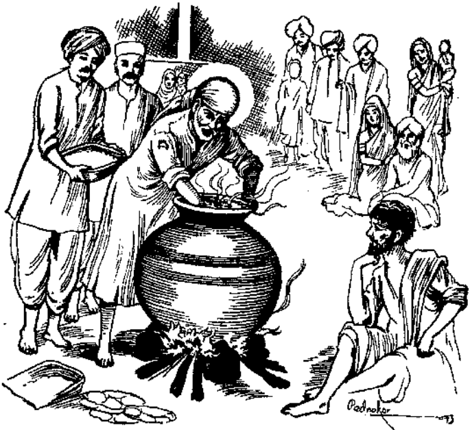
श्री साईबाबा हंडीत भन्न शिजवित अक्षतना