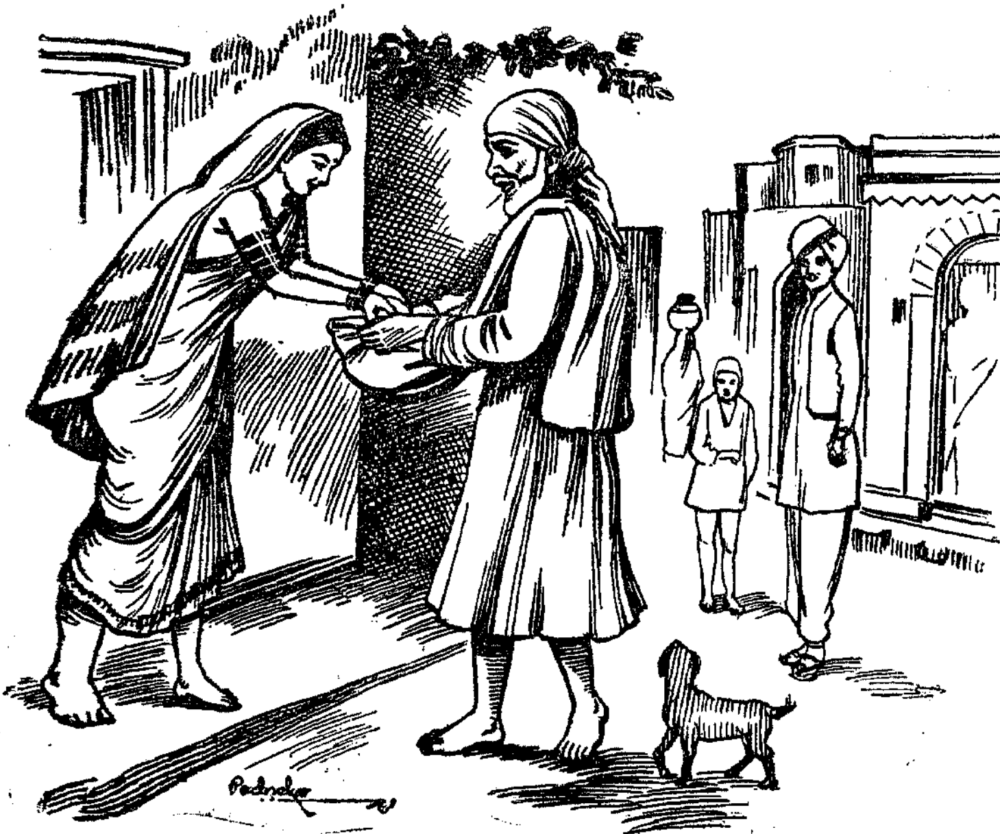
बाबा भक्तांकडून भिक्षा घेताना